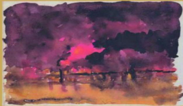
V بَادِيَةِ الظُّلْمَات